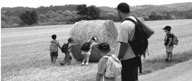
Camp d'estiu 2004. Anem empenyent.

Per l'activitat desenvolupada per l'Associació Vall del Corb, amb la col·laboració de l'Esplai l'Oliva de Sant Martí de Maldà i l'Agrupament Escolta i Guia Terra Plana de Belianes, en la qual destaca, a més del seu excel·lent disseny i la seva acurada presentació, el fet que les activitats realitzades combinen molt bé la intenció de reforçar l'arrelament i el coneixement del propi medi aprofitant els recursos que aquest ofereix, amb el propòsit de conrear valors actualment tan necessaris com la sostenibilitat, la pau i la interculturalitat.