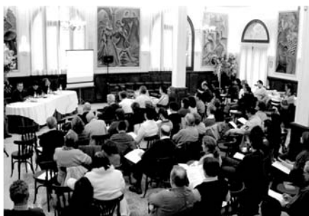
L'Hotel Regina va acollir l'acte

Incrementar els punts de diàleg entre societat civil, administració i món empresarial i cooperatiu, i evitar els localismes, que impedeixen que ens assestem tots per debatre quin model de riquesa volem pel nostre territori, fou una de les conclusions de la interessant jornada que acabà ja al vespre amb un refrigeri per a tots els assistents.